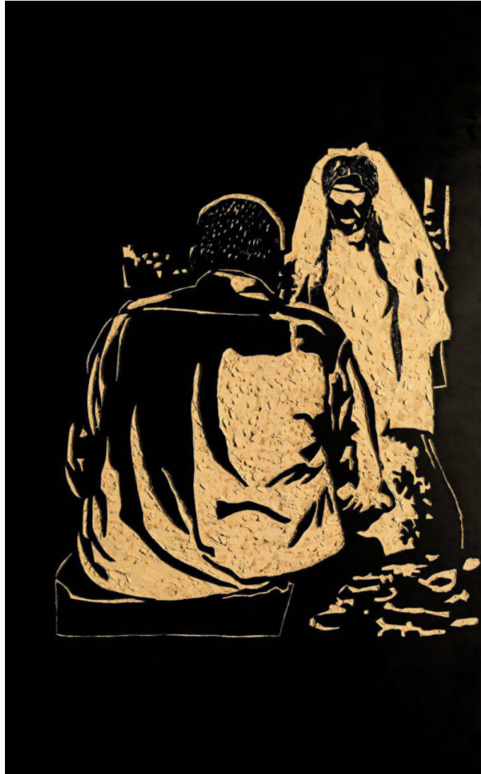
היבה אבו ג'נב, נישואי קטינות, 2014.

עוד שלוש אמניות שבלטות לטובה בתערוכה הן חנין חסן, שמציגה שני ציורים גדלי ממדים ושתי עבודות נוספות של ציור על קרשים, שבמיומנות מביאות עולם שנע בין פנטזיה לאימה, באמצעות שימוש בשילובי צבעים חזקים על גבול הפסיכדליה ובחירת דימויים שנעים על רצף שבין תפישת מציאות תקינה לעיוות תודעתית; דנה לאור קוגן מציגה על מערכת מדפים מרשימה בקבוקי זכוכית שבתוך כל אחד מהם מונח תצלום פולארויד שנכבש בשמן זית ומכלה בהדרגה את התצלום. המיידיות של הפולארויד לעומת הפעולה האטית והמסורת הנקשרת בשמן הזית מעלה שאלות מעניינות והעבודה בעיקר מרהיבה מבחינה ויזואלית; איאת נסאר מציגה צילומים קטנים, חלקם קולז'ים המורכבים מנגזרות של צילומים המודבקים על צילומים אחרים, שבהם היא מפגינה עין חדה ומתוחכמת שרואה את הסביבה ה"כפרית" או "מסורתית" בראייה אירונית, פרטנית, אשר מקנה משמעות חדשה גם לדימויים בנאליים וסטריאוטיפיים לכאורה.