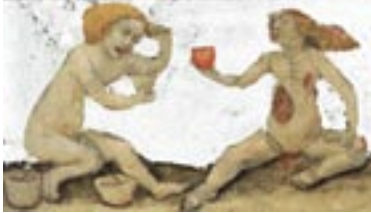
unknown artist, 14th century

Ehad Ha'am 1 , from 'Truth from the Land of Israel', first article (from my first journey in 1890):