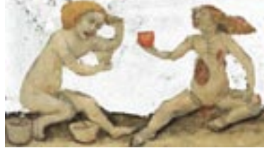
מאה ה-14, צייר לא ידוע

"אחר שנים רבות שעברו עלי בהגיונות ודמיונות על דבר ארץ אבותינו ותחיית עמנו בה, זכיתי עתה סוף סוף לראות בעיני את נושא חלומותי, את ארץ הפלאות ההיא המושכת אליה רבבות לבבות מכל העמים ומכל המדינות. כשלושה חדשים עשיתי בארץ. ראיתי את חרבותיה - שארית חייה לשעבר, התבוננתי אל מצבה האומלל בהווה, אך ביחוד שמת לי לב אל העתיד, ובכל אשר התהלכתי הייתה שאלה אחת תמיד אל נגד עיני... עתה הנה עזבתי את הארץ משאת נפשי, עזבתי בלב נשבר וברוח נכאה ודמיוני לא בן חורין הוא עוד עתה להגביה עוף כמלפנים".