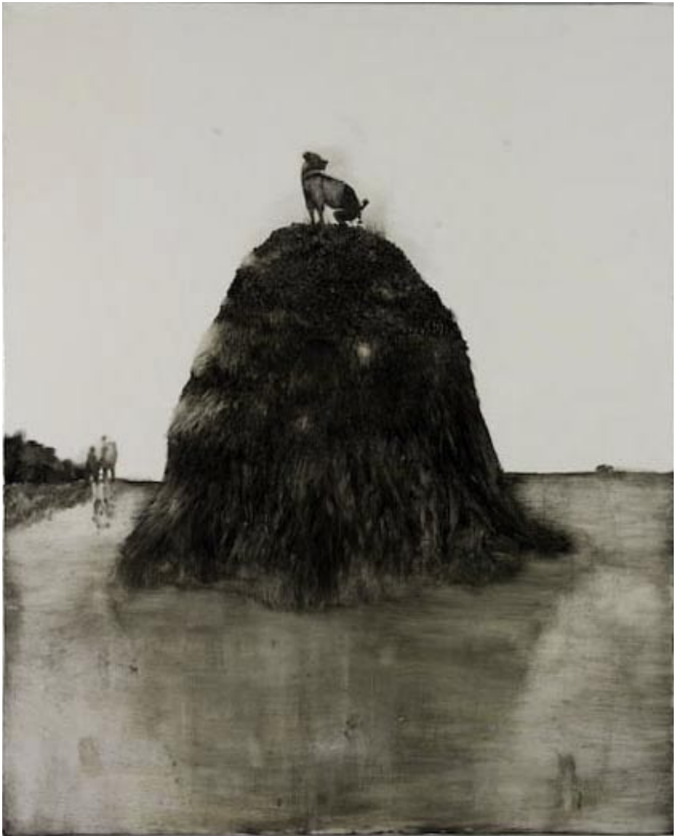
ללא כוחרת, שמן על בד, 160x130 Untitled, oil on canvas, 130x160