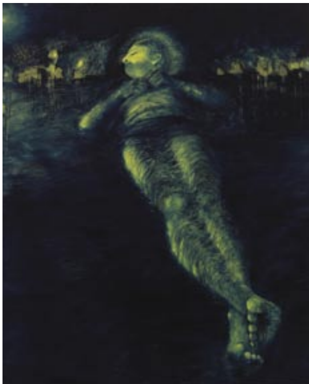
ללא כותרת , שמן על בד, 170x130 Untitled , oil on canvas, 130x170