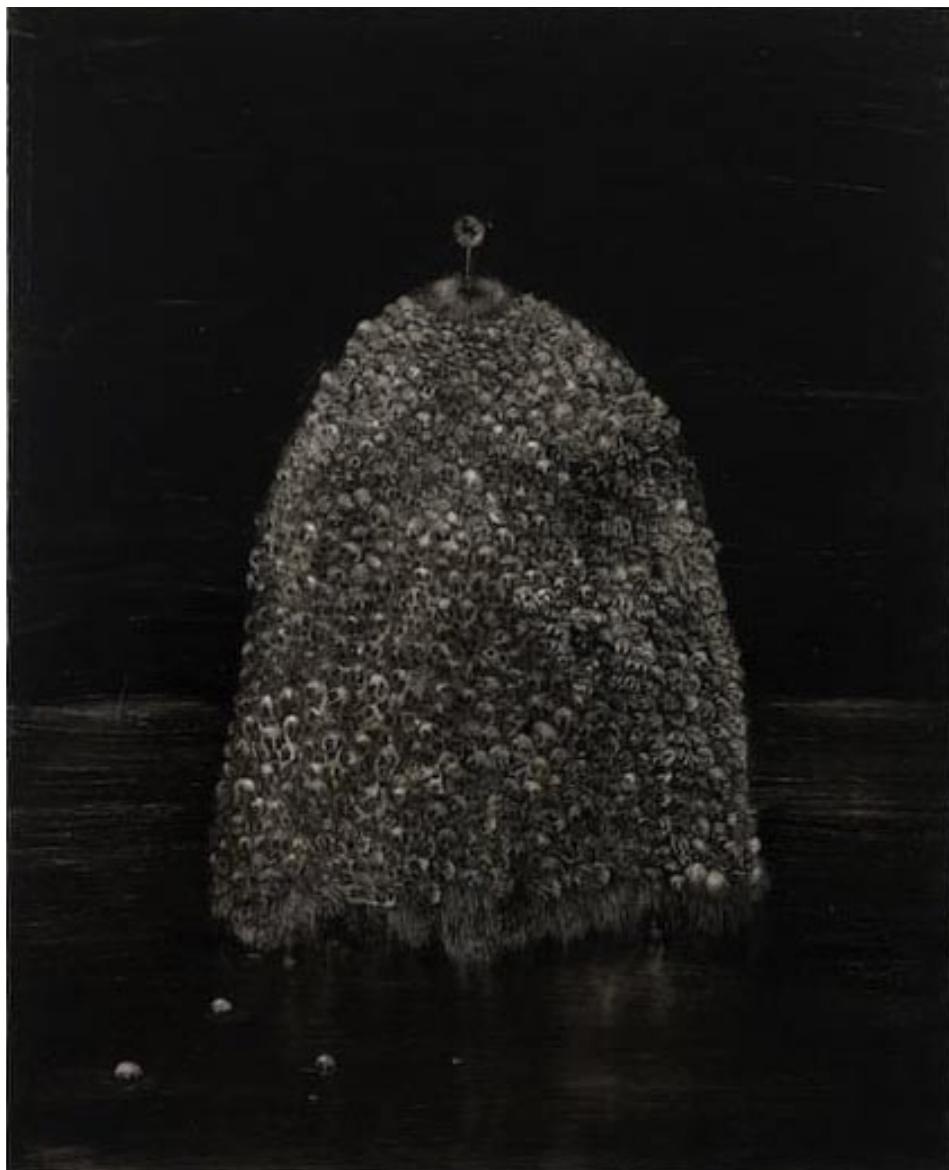
ללא כותרת , שמן על בד, 130x160 Untitled , oil on canvas, 130x160