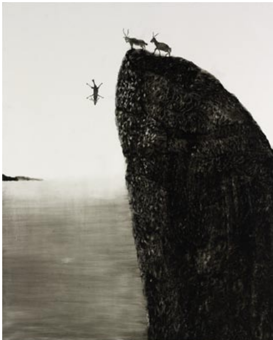
ללא כותרת, שמן על בד, 160x130 Untitled , oil on canvas, 130x160