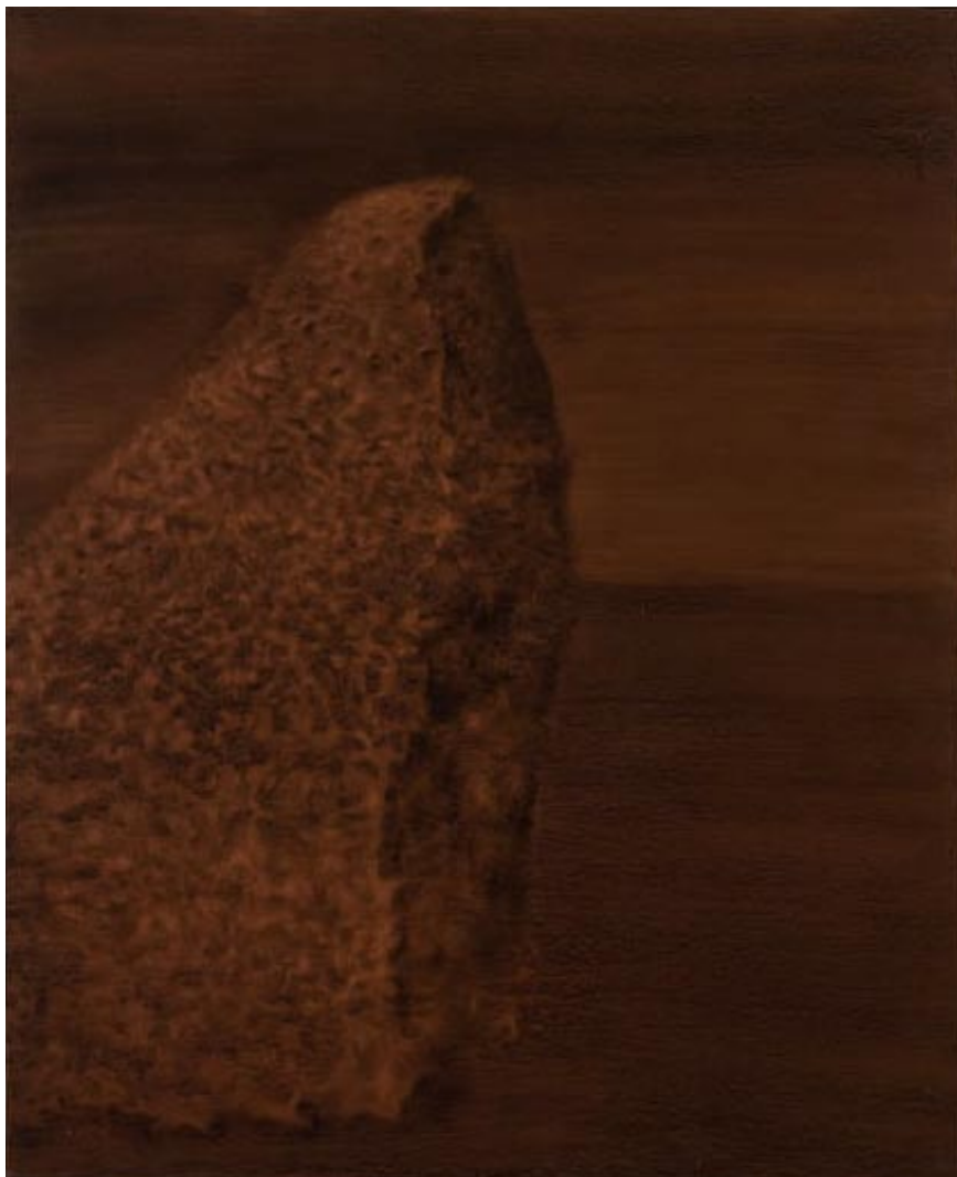
ללא כותרת, שמן על בד, 160x130 Untitled, oil on canvas, 130x160